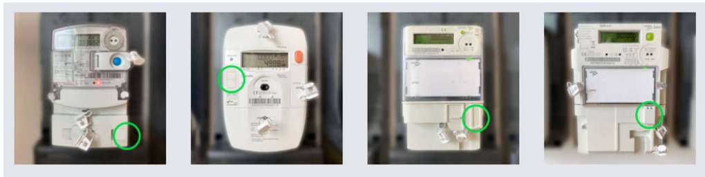
Mogelijke locaties P1 poort